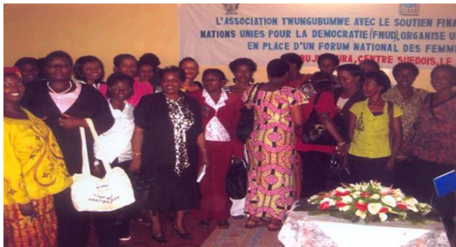
Atelier de mise en place du Forum National des femmes leaders élues

Le rapprochement des femmes leaders de la base au sommet n'a pas eu lieu et aucun élément n'a permis d'ébaucher une politique en faveur des femmes pendant et après ces élections. La Signature et approbation d'un texte de loi visant à l'amélioration des conditions de vie de la femme reste un vœu pieux. Aucun document et aucune indication sur le terrain ne permet de vérifier les propositions d'amendements d'un cadre légal en faveur des femmes notamment en matière de droits de successions et d'héritage. A