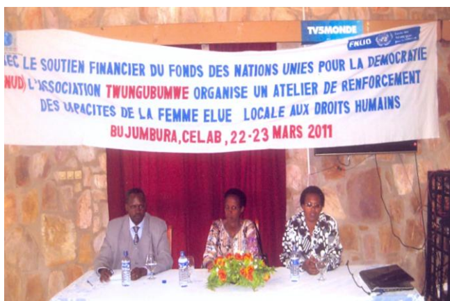
Atelier de renforcement des capacités de la femme élue locale aux droits humains

Les entretiens ont montré que certains bénéficiaires ont participé à des sessions de formation/sensibilisation similaires mises en œuvre par les plateformes des OSC, la CENI etc. sur la promotion du genre. Les journalistes interviewés ont d'ailleurs déclaré avoir participé à de nombreuses autres formations similaires sur la promotion du genre organisées par l'UNESCO, la CENI etc. Rappelons aussi que les journalistes ont été vivement sollicités dans le cadre du PACAM, qui a permis de relayer les messages en matière de la promotion du genre des radios sur tout le territoire burundais. Aucune des bénéficiaires interrogées n'a été capable de déterminer l'efficacité et la valeur ajoutée de ces sessions de sensibilisation/formations, en comparaison des autres formations reçues.