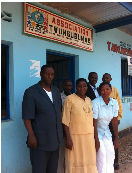
Equipe de gestion du Projet et l'expert local

Ce projet est la première initiative initiée par l'Association TWUNGUBUMWE avec un partenaire extérieur. L'association TWUNGUBUMWE a recruté l'équipe du projet, composée de cinq personnes y compris le coordinateur, deux personnes de suivi, et deux personnes de gestion basées à Bujumbura. A l'issue des entretiens menés avec l'équipe du gestion du projet, il reste difficile de déterminer les modalités d'exécution qui ont prévalu au sein de l'Association TWUNGUBUMWE pour mettre en œuvre ce projet et pour en valider les résultats.