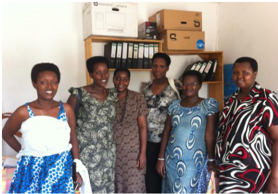
Echantillon d'observatrices électorales domestiques à Bujumbura (Photo F. Burban, 2012)

au médias (PACAM) ; qui ont toutes servi à éviter la duplication des activités, et à renforcer la crédibilité et la cohérence des actions des OSC sur le terrain en proposant des approches communes à toutes les OSC. L'approche de l'association TWUNGUBUMWE qui a isolé ses actions de celles menées par les plateformes des OSC a réduit considérablement la pertinence de l'ensemble du projet.