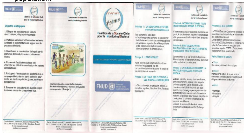
Le dépliant du projet